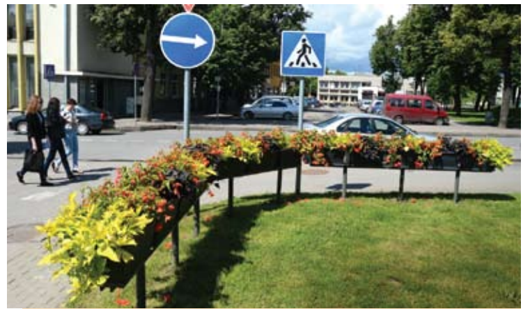
Gėlės Vilniaus ir Taikos gatvių sankirtoje.

lengvai auginamos ir nereiklios gė- lės: serenčiai, žilės, žioveniai, mar- geniai, salvijos ir kitos. Kitą grupę gėlių daigų perkame iš gėlininkystės įmonių, o gėles „karalienės“ išigyja- me iš jas auginančių firmų. Kasmė- t norisi anykštėnus ir miesto svečius pradžiuginti, tad šiemet pasigami- nime naujus stovus gėlinėms įren- gti. Įvairių formų gėlinių daugiau bus pastatyta prieš miesto šventę“.