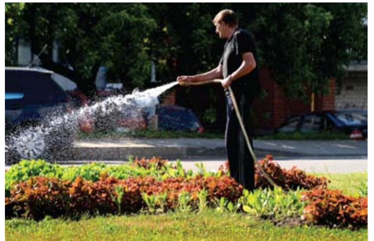
Per sausrą gėlynus tenka laistyti kasdien.

„Anykščių gėlynuose pernelyg daug ryškių spalvų - pastebėjo flo- ristė. – Dabar Europoje vyrauja jau kitos tendencijos ir kryptys“.